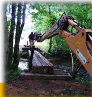
POSE DE LA PASSERELLE