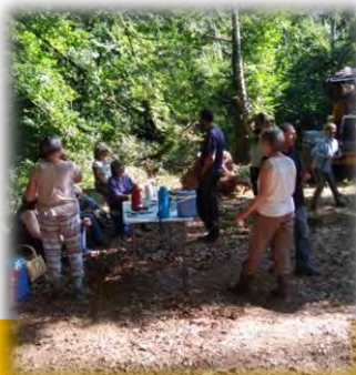
PAUSE CASSE CROÛTE